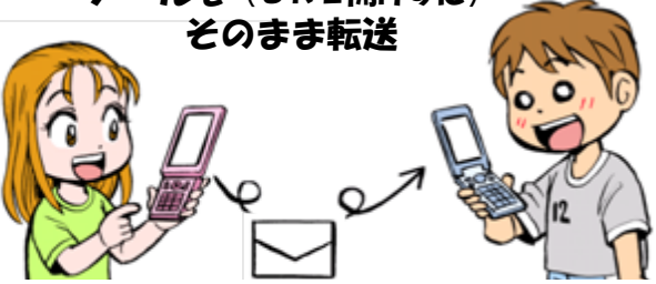
ご自身 ※パソコンでも操作可能です。 譲渡先の方

③メールを受け取った譲渡先の方は、メールの本文にあるURLをクリックして、二次元コードを表示します